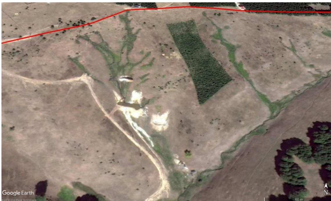
Слика 3. Предлог за проширење 2. зоне заштите на тресавску долину извора Старац (горе) и трагови експлоатације тресета у кориту извора у долини потока Старац (доле)