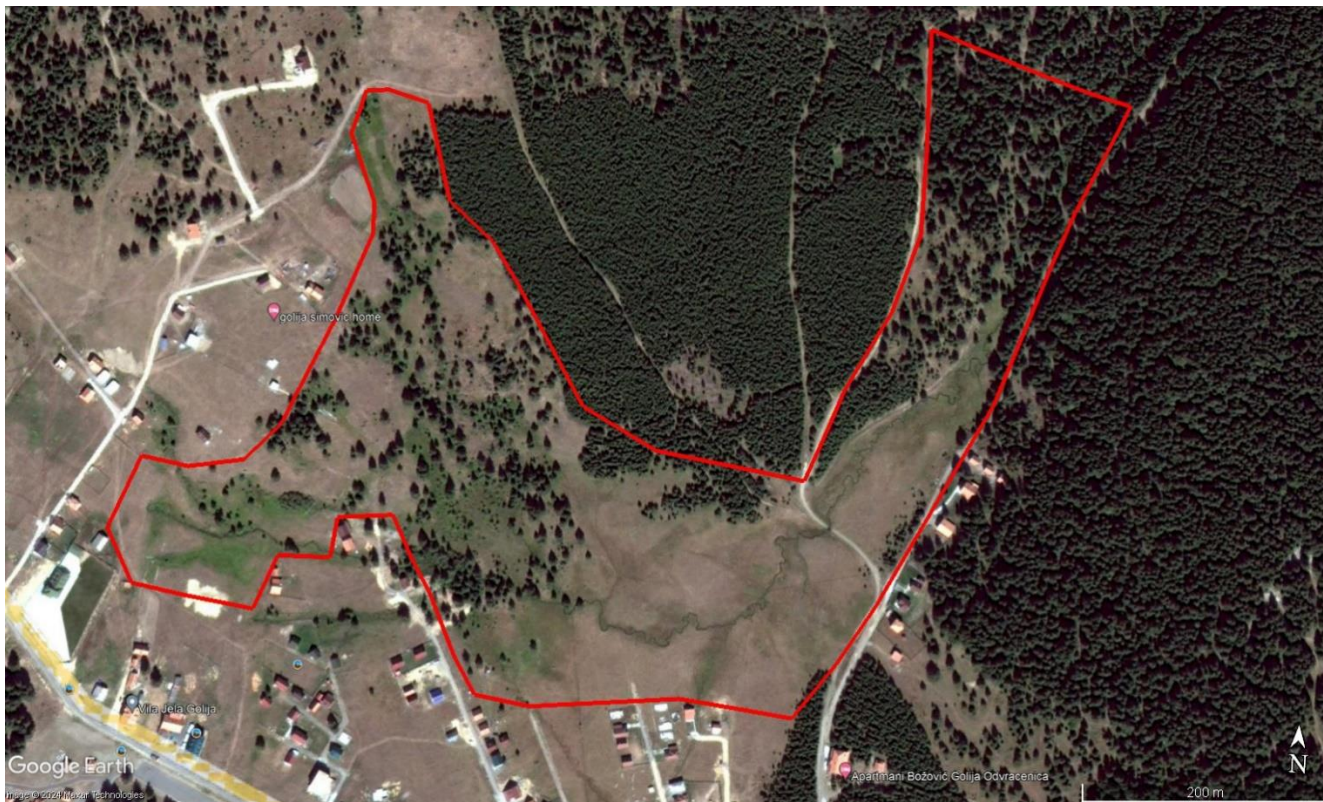
Слика 2. Предлог за проширење 2. зоне заштите на високопланинске тресаве на локалитету Одвраћеница

2. У Студији заштите ПП „Голија“ проширити 2. степен заштите на тресавску долину извора Старац, локалитет Одвраћеница, са пратећим изворима (Слика 3) на којима се налази тресавска вегетација која у будућности може бити потпуно уништена потенцијалном (дивљом) изградњом и загађењем. Како се ради о једном од најређих типова станишта на планети Земљи, те да већ постоје трагови експлоатације тресета на овом локалитету (Слика 3) од приоритетног је значаја да овај локалитет буде заштићен и зонирани као 2. степен заштите. Означена површина износи 32,2 хектара.