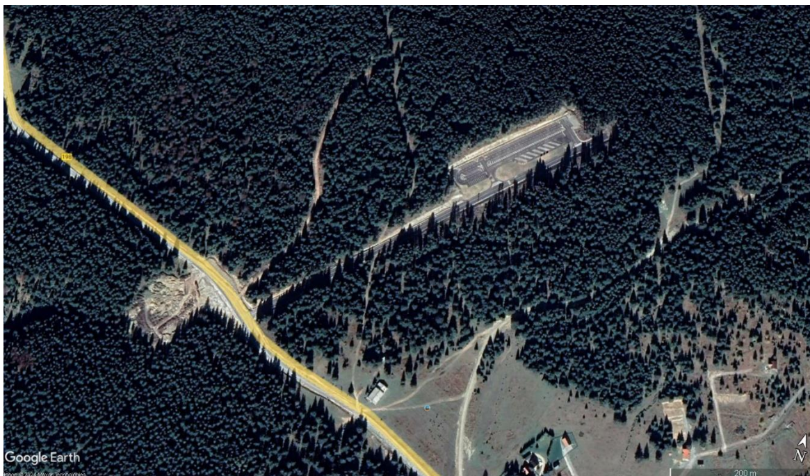
Слика 1. Сателитски снимак пре изградње (2018. година) и након изградње паркинга (2022. година) унутар шумског комплекса