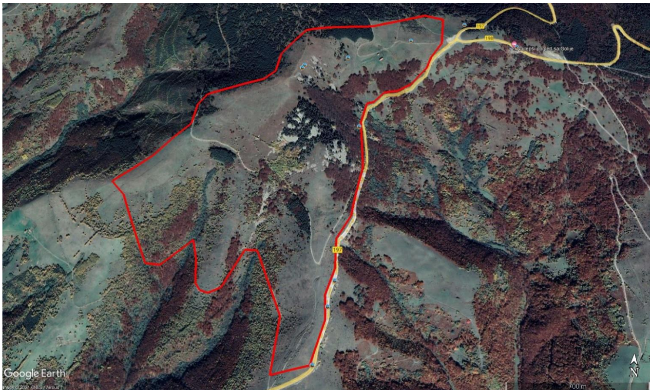
Слика 4. Предлог за проширење 2. зоне заштите на локалитет Бојево брдо са сипарима, малом тресавом и цирком

14. У Студији заштите ПП „Голија“ проширити 2. степен заштите на Бојево брдо на којима се налазе највећи камењари и сипари на Голији, мала тресава и цирк (Слика 4) који је посебно наведен у члану 5. Уредбе о заштити тачка 10 за локалитет где је забрањена „промена морфологије терена и пошумљавање у цирковима и у њиховој близини, изградња објеката којима би се они заклонили и којима би се онемогућило њихово посматрање као и преграђивање водотокова“. Како је то истовремено један од најлепших видиковаца на Голији није искључено да бу у будућности био потенцијална локација за (дивљу) изградњу будући да се према тренутном Нацрту Студије и Уредбе заштите налази у 3. степену заштите. Означена површина износи 166 хектара.