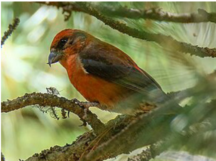
Krstokljun ( Loxia curvirostra )