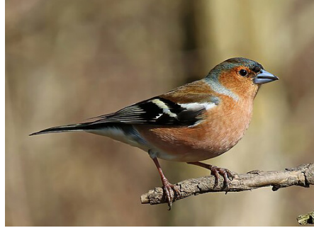
Obična zeba ( Fringilla coelebs ), žargonski naziv: belokrilka