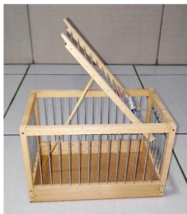
Obični kapan

Nešto jednostavniji model je tzv. običan kapan, koji nema mogućnost automatskog povratka u prvobitni položaj, ali je najjednostavniji, a samim tim i najjeftiniji za izradu i prodaju. Praksa prepoznaje aktivne i neaktivne kapane, odnosno kapane koji se koriste u kombinaciji sa pticom pevačicom ili električnom vabilicom koja simulira zov mužjaka ciljane vrste i kapane koji nisu u upotrebi, ali mogu u svakom trenutku biti aktivirani.