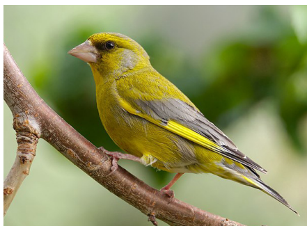
Zelentarka ( Chloris chloris ), žargonski naziv: kringlov