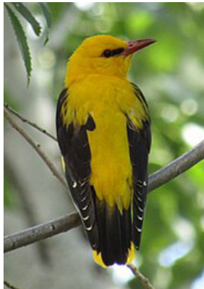
Vuga ( Oriolus oriolus )