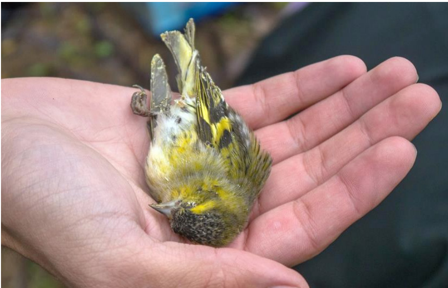
Uginula jedinka strogo zaštićene vrste čižak, Foto: Arhiva DZPPS

Prodaja ptica pevačica na oglasima je znatno opala u poslednjih nekoliko godina, zbog strože kontrole oglasnika. Međutim, zbog slabe ili nikakve kontrole grupa na društvenim mrežama, ovaj vid trgovine je stvar svakodnevice. Takođe, iako se na javnim berzama sitnih životinja beleži pad prodaje ptica uzetih iz prirode, gotovo uvek se u manjim mestima, a naročito na buvljim pijacama, mogu pronaći primerci nelegalno stečenih ptica. Godine 2017. na jednoj beogradskoj pijaci u centru grada, otkriven je i priveden ilegalni trgovac koji je u pijačnom cegeru imao kaveze sa 29 strogo zaštićenih ptica pevačica, među kojima su bile vrste češljugar, zelentarka i čižak, dok je kod istog lica, u praznoj kutiji sredstva za pranje veša pronađena i jedinka strogo zaštićene vrste obični kos. Istom prilikom, policijski službenici otkrili su još jedno lice, koje je u prtljažniku automobila imalo nekoliko kaveza punih strogo zaštićenih ptica. Ptice su bile u vidno lošem stanju, a kod nekih je došlo do uginjavanja, što je čest slučaj kod ovakvog vida trgovine. Veoma je česta i međumesna trgovina, gde se ptice predaju vozačima autobusa na međugradskim linijama. Ovako zapakovane pošiljke sa živim pticama putuju od mesta do mesta, uz malu novčanu naknadu vozačima autobusa, čime se, između ostalog, krši i Zakon o dobrobiti životinja u delu koji se odnosi na transport životinja.