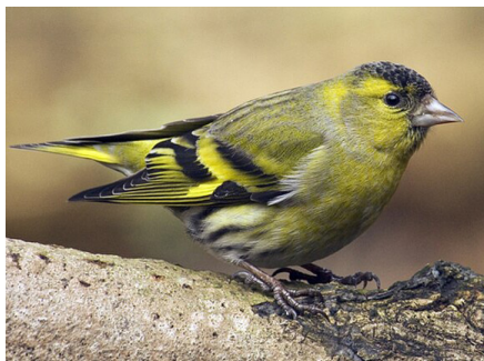
Čížak ( Spinus spinus ), žargonski naziv: cajzla