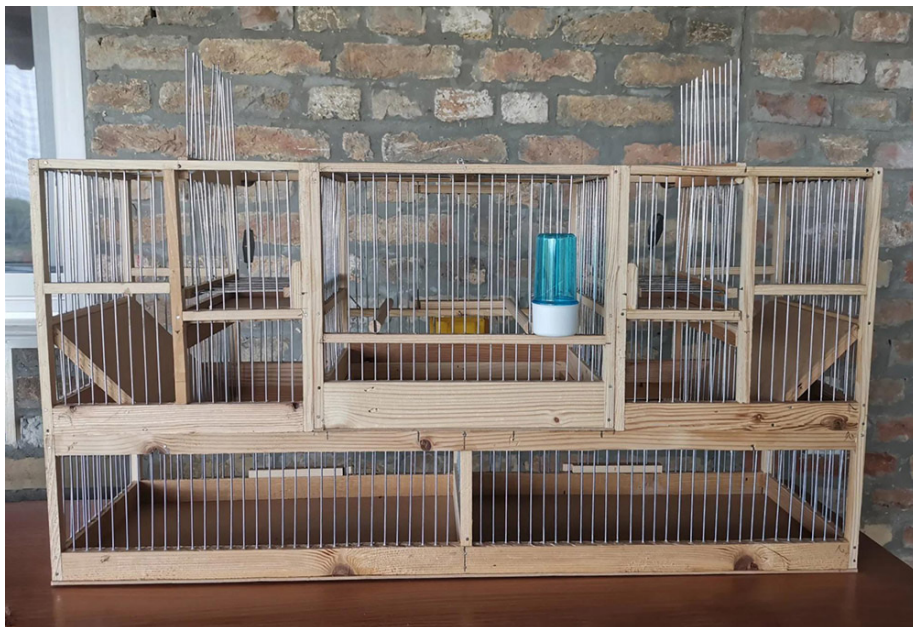
Turski kapan , Foto: Arhiva DZPPS

i koje svojom pesmom dozivaju jedinke iste vrste u zatočeništvo. Ovaj metod nezakonitog lova je izuzetno problematičan za otkrivanje, jer se često koriste u dvorištu ili na terasi, odnosno prozoru stambenog objekta. Na tržištu u Srbiji može se naći veliki broj različitih modela kapana. Jedan od najopasnijih modela je tzv. turski kapan, koji ima mogućnost automatskog okretanja rešetke, tako da nakon upadanja ptice u klopku, ona dospeva u posebnu pregradu na dnu zamke, dok se mehanizam automatski vraća u prvobitni položaj i spreman je za hvatanje naredne jedinke.