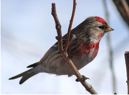
Juričica ( Acanthis flammea ), žargonski naziv: mer cajzla