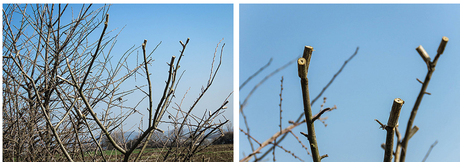
Umetak za češljuge je indikator hvatanja ptica lepkom, Foto: Arhiva DZPPS

Lov lepkom je zabranjen vid lova koji podrazumeva premazivanje grana lepljivom supstancom (najčešće lepkom za glodare ili topljenom gumom) koja pticu momentalno hvata u ovu, neretko smrtonosnu, zamku. Ptice koje upadnu u lepak u svojim pokušajima da se oslobode, mlate krilima, čime dolaze u opasnost od potpunog oblepljivanja, što vodi do gubitka operjalosti, ogromnog stresa i uginjavanja. Lepak se premazuje na pažljivo odabrane grane, na čijim vrhovima se nalaze valjkasti, drveni umeci u koje se postavlja čičak (češljuga) kojim se ptice hrane. Lepak se kasnije sa ptica skida benzinom, dok se ptice koje za krivolovce nemaju upotrebnu vrednost, čupaju iz lepljive zamke i bacaju, što vodi do sigurnog uginjavanja. Ovaj metod lova koristi se i u kombinaciji sa živim mamcem.