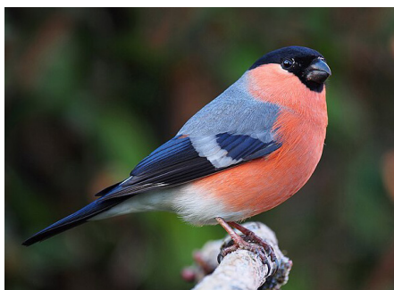
Zimovka ( Pyrrhula pyrrhula ), žargonski naziv: gimpla