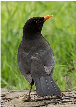
Običan kos ( Turdus merula )