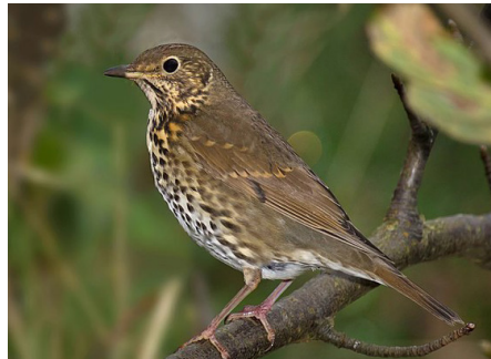
Drozd pevač ( Turdus philomelos )