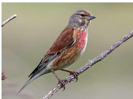
Konopljarka ( Linaria cannabina ), žargonski naziv: aniflan