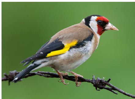
Češljugar ( Carduelis carduelis ), žargonski naziv: štiglič