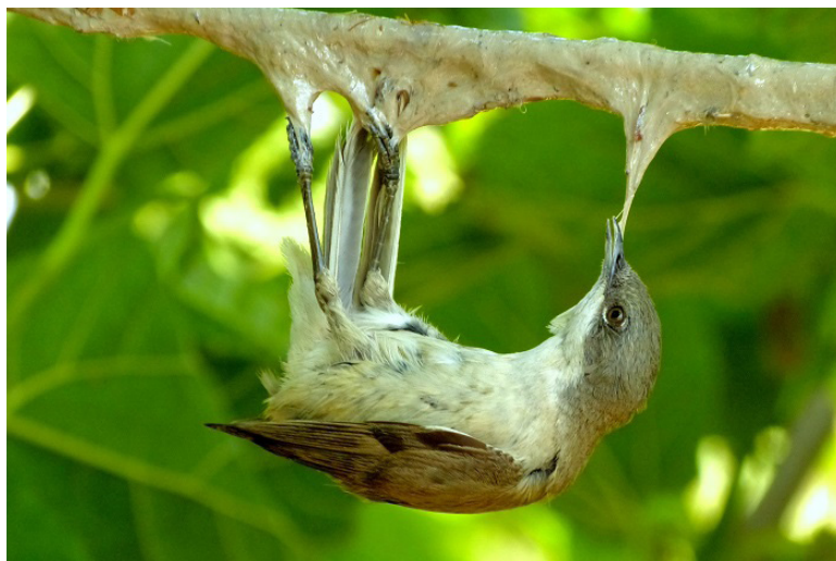
Lepak za ptice