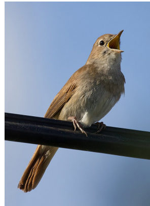
Mali slavuj ( Luscinia megarhynchos )