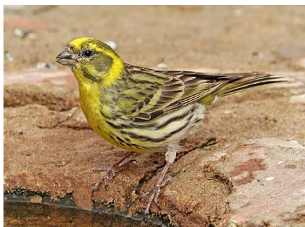
Žutarica ( Serinus serinus ), žargonski naziv: štancer, štanc cajzla