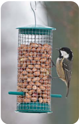
Различити типови хранилица